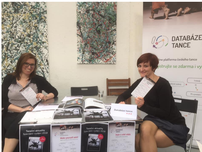
Prezentace v rámci České taneční platformy 2019