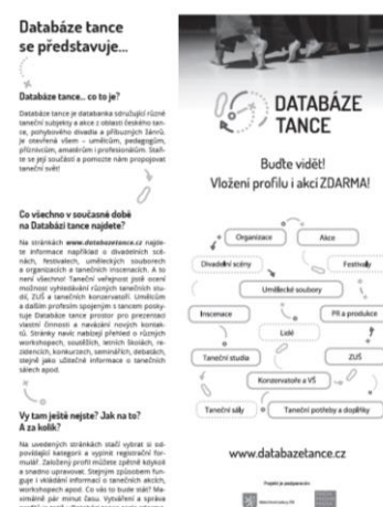
Ukázka PR textu v časopise pam pam