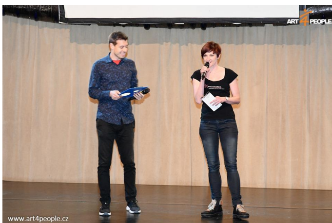
Prezentace v rámci Mezinárodního dne tance 2019