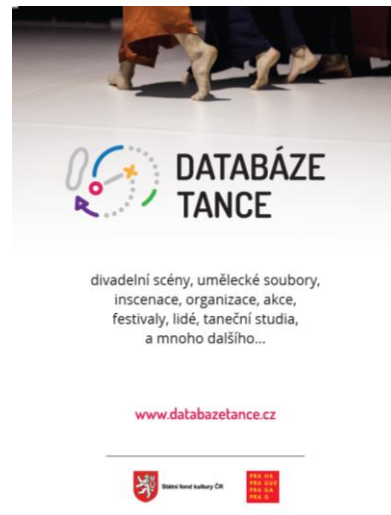
Ukázka inzerce v časopise Národního divadla